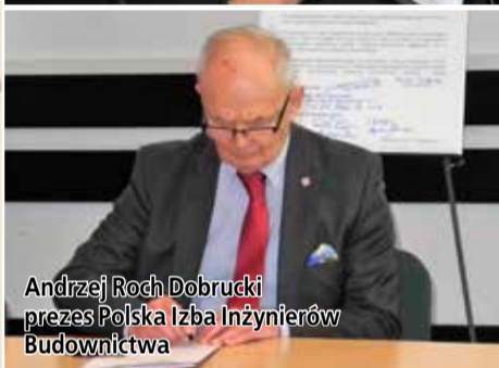
Andrzej Roch Dobrucki prezes Polska Izba Inżynierów Budownictwa